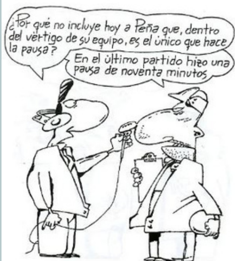
Caricatura de Roberto Fontanarosa