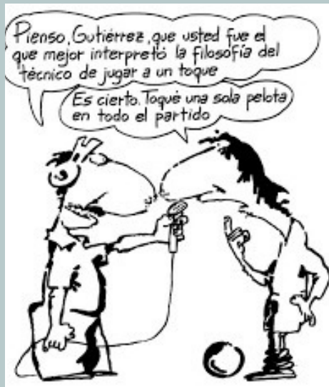
Caricatura de Roberto Fontanarrosa