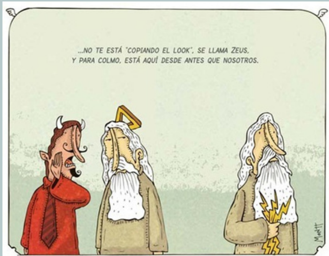
Caricatura de Alberto Montt