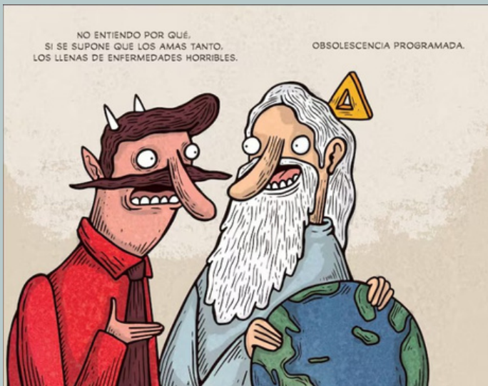
Caricatura de Alberto Montt

La reunión concluyó con un compromiso transversal de todos los presentes, quienes coincidieron en la necesidad de equilibrar la actual carga laboral con las tareas de control preventivo en terreno.